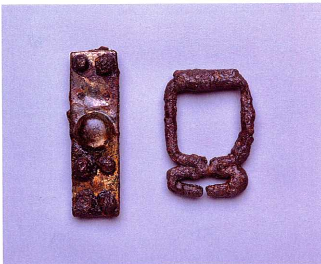
馬具 鉄地金銅張帯金具（左）と鉸具（右）

わたしがつみにつけているのが 馬具だよ。本当はキンピ カだったのよ。 てんじしゅつどで実物を見 てね