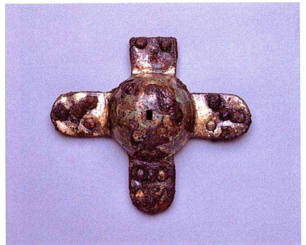
馬具 鉄地金銅張辻金具