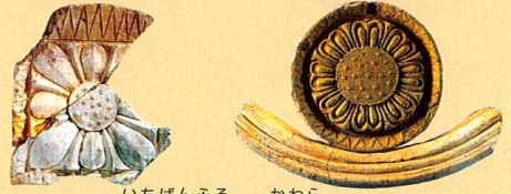
いちばんふるい 一番古い瓦

どちらもハスの花の模様をしているね。 「瓦」は大切なお寺を雨や風から守るために屋根に置かれたよ。屋根のどの部分にどの瓦が使われているか、よく見てごらん。