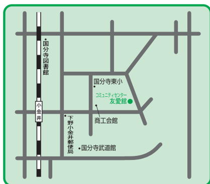
コミュニティセンター友愛館