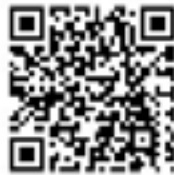
申し込み用 QR コード