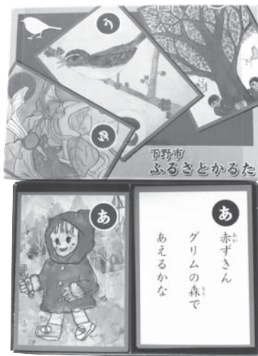
↑下野市ふるさとかるた