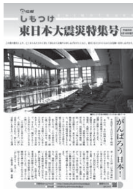
H23年5月・特集号 東日本大震災に関する記事の 特集号。