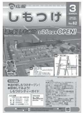
H23年3月・第62号 道の駅しもつけオープンのお 知らせ。