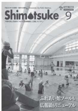
H24年9月・第80号 ふれあい館プールも 広報紙もリニューアル。