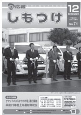
H23年12月・第71号 デマンドバス「おでかけ号」 運行開始。