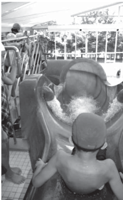
ウォータースライダー