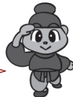
こまる（下毛野朝臣古 麻呂）〔下野薬師寺の建 立、大宝律令の選定に 携わった下野市ゆかり の人物〕

まちづくりを進めるための3つのルール（原則）に「情報共有」があっ たよね。まちづくりは、まちの情報を知ることから始まるんだよ。