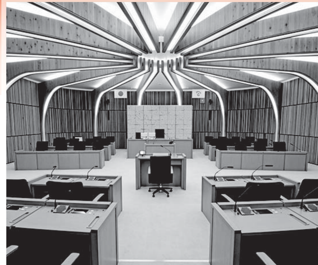
かんぴょうの原材料、ゆうがおの実をイメージしたデザインの議場