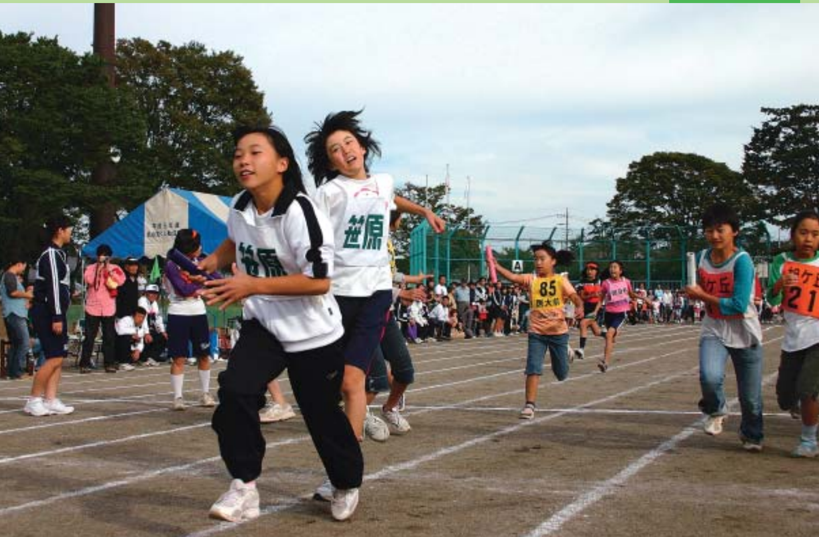
市民体育祭が開催されました