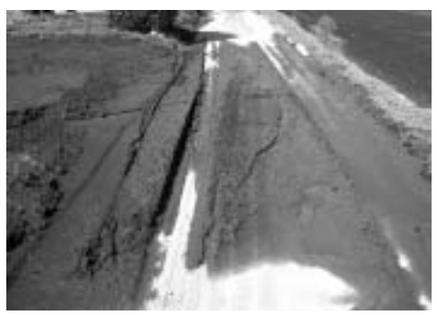
道路へ流失した土砂