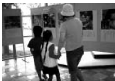
「原爆と人間展」の様子

情報センターは図書館のように人の出入りが多い場所ではないので、当初見に来ていただけたかどうか不安でしたが、7日間で161名もの方