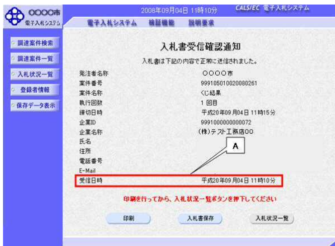
図1. 1. 入札書受信確認通知