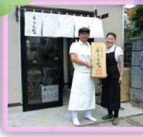
日光二荒山神社に 奉納されました