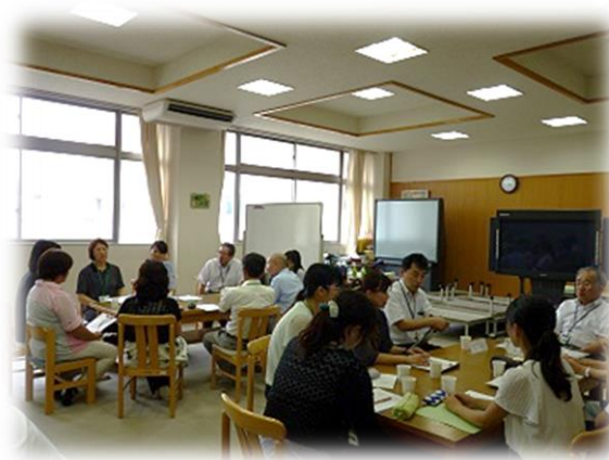
緑小学校での教職員との懇談