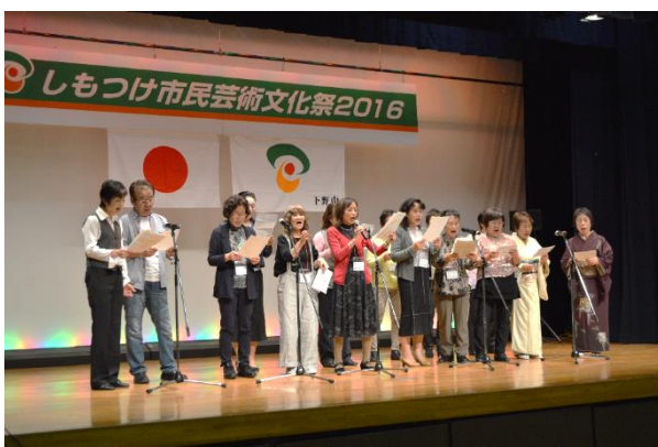
しもつけ市民芸術文化祭