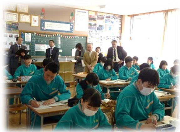
南河内中学校での授業参観