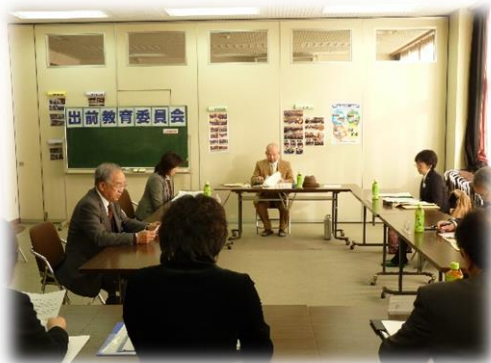
南河内中学校で開催された出前教育委員会