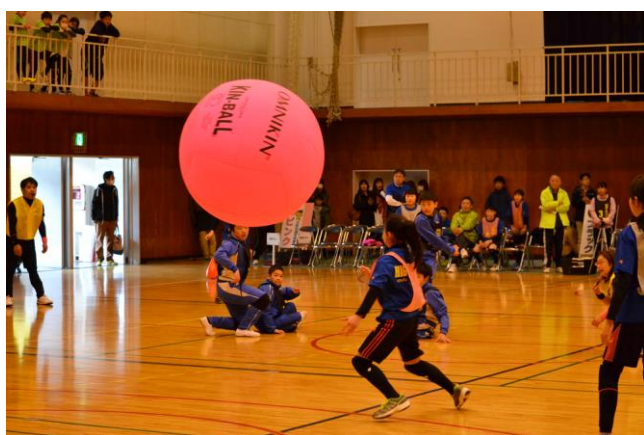
下野オープンキンボールスポーツ大会