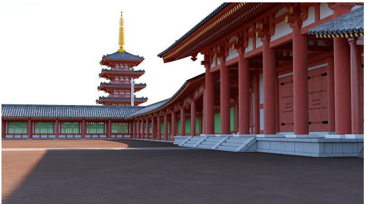
下野薬師寺跡VR画像