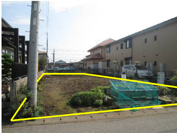
撮影地点 2 から