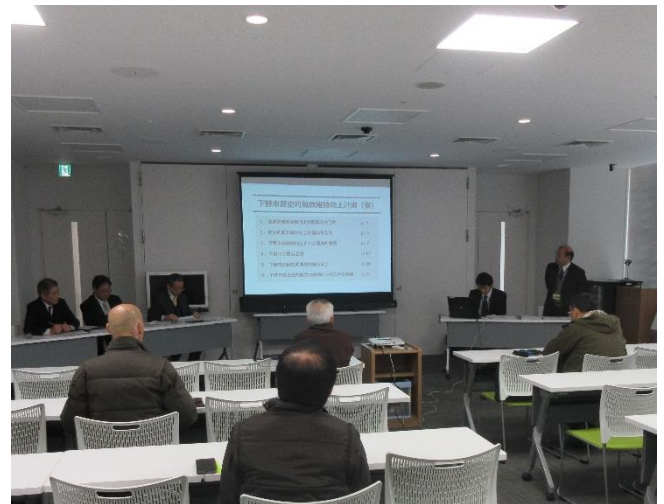
下野市歴史的風致維持向上計画（案）住民説明会