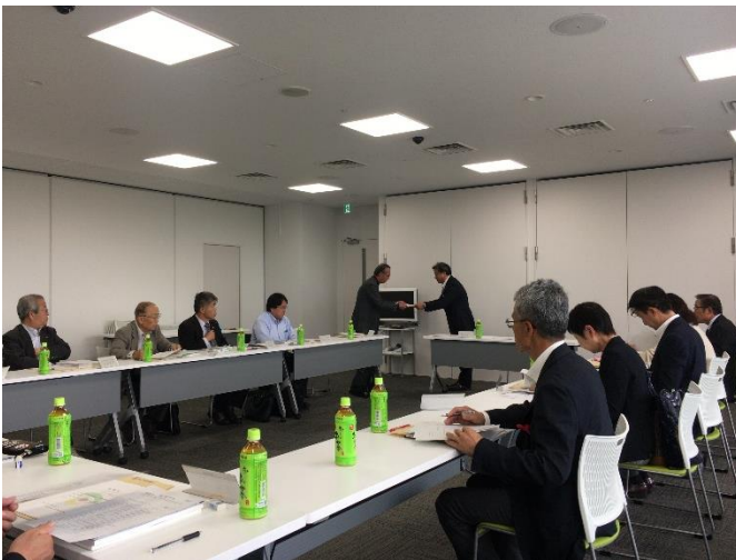
第 1 回下野市歴史的風致維持向上計画策定検討委員会