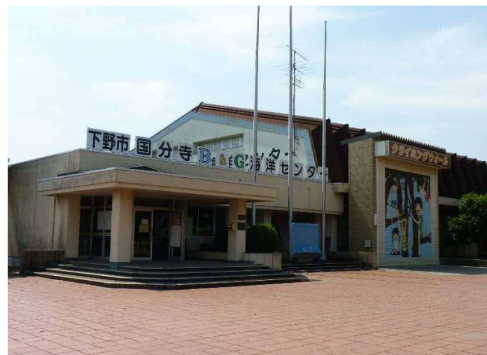
国分寺B&G海洋センター改修事業