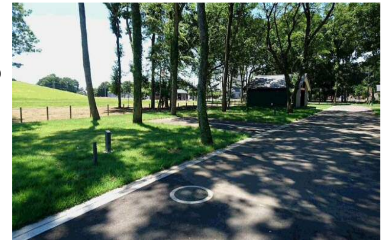
三王山地区公園整備