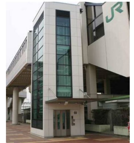
自治医大駅東口エレベーター