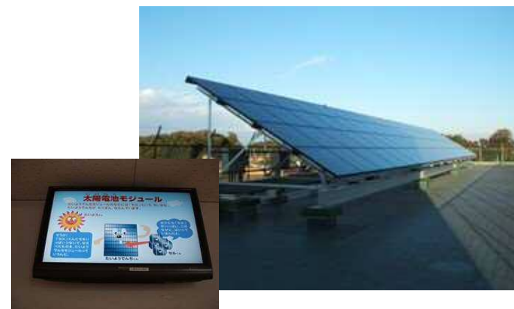
学校太陽光発電施設(国分寺東小)