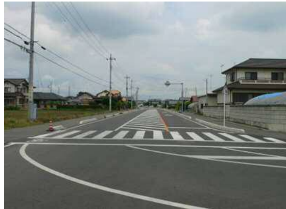
仁良川地区土地区画整理事業