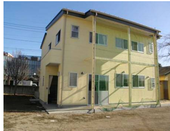
国分寺小学童保育室整備