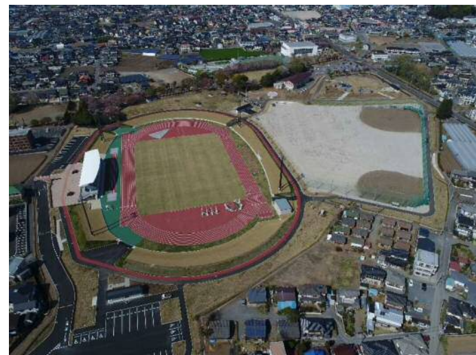
大松山運動公園拡張整備事業