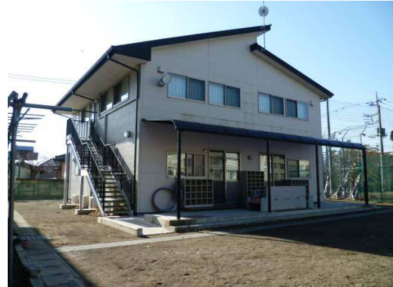
薬師寺小学校学童保育室