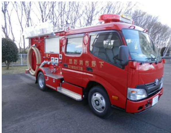
消防ポンプ自動車整備(第3分団第3部)