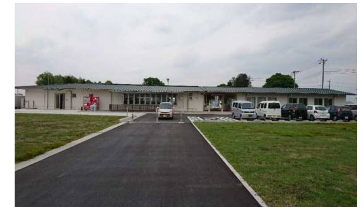
石橋地区都市農村交流施設(ゆうがおパーク)