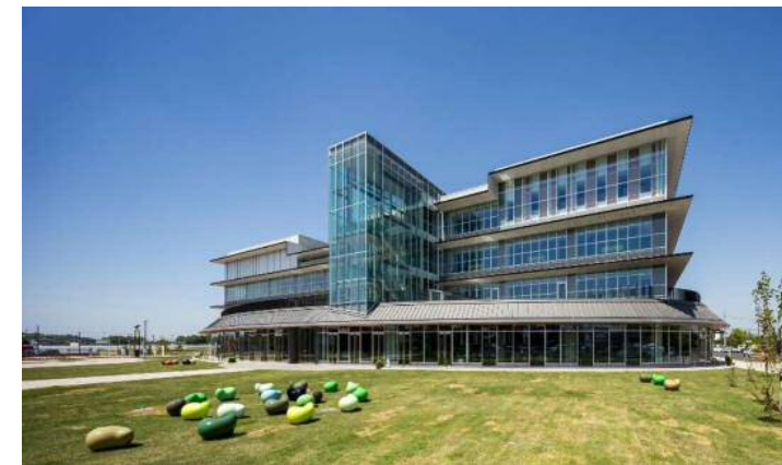
下野市役所 新庁舎