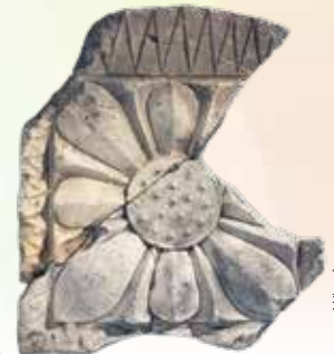
下野薬師寺歴史館 蓮華文鬼瓦