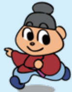
歴史館キャラクター こまろ