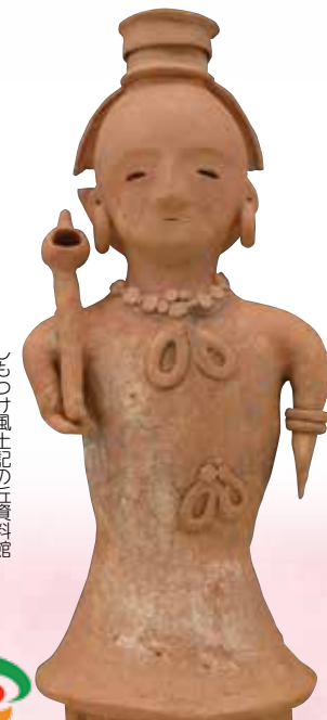
しもつけ風土記の丘資料館 甲塚古墳出土人物埴輪(重要文化財)