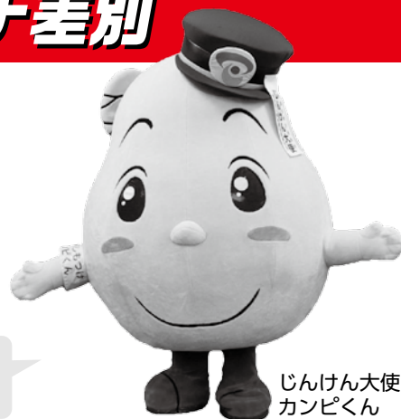
じんけん大使 カンピくん