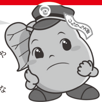
じんけん大使 カンピくん