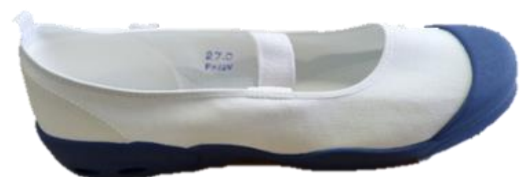
(1～4年生:現在の小学校のものを使用)