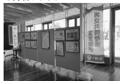
昨年度の展示の様子