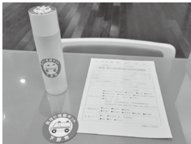
見守り情報キット

登録した方には、見守り情報キットを配布しています。これは、かかりつけ医療機関、持病、緊急連絡先などの情報を記入した用紙を専用容器に入れ、各ご家庭の冷蔵庫に保管し、ステッカーを貼って表示しておくことで、万一の緊急支援時に活かすものです。