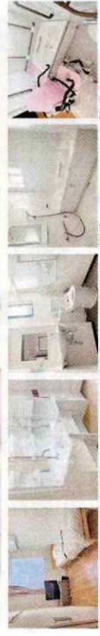
【原案】 全室は全てイメージです。実際には異なります。また、居室の家具等は機材付ではありません。 【1階】 【2階】 【浴室】

全室約6帖(収納スペース付き) 冷暖房完備、TV受信、照明付き Wi-Fi完備 エレベーターあり