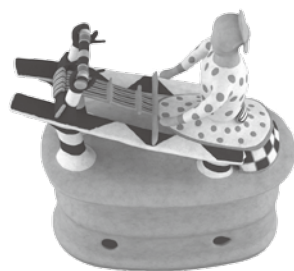
甲塚古墳出土遺物(機織形埴輪の指定復元CG)