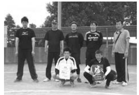
石橋会場優勝：下古山チーム