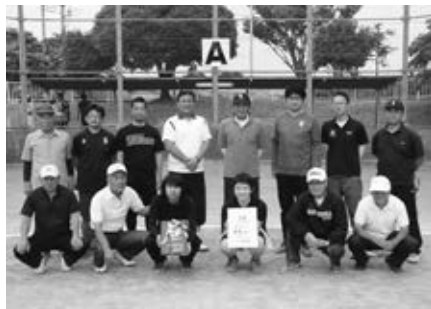
国分寺会場優勝：小金井下町チーム