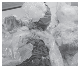
二重袋・汚れたビニール