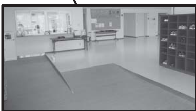
段差がなくなり緩やかなスロープに