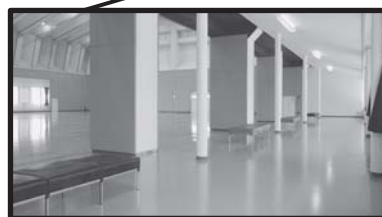
西側に約5メートル増設