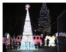
グリムの森 イルミネーション