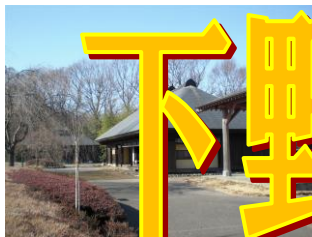
夜明け前 (民族資料館)