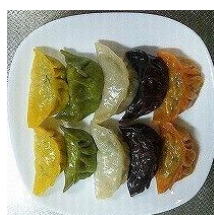
かんぴょう入り 五色餃子