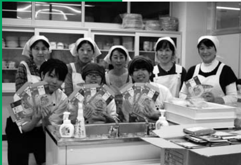
商品のパッケージ

栽培方法から料理方法、パッケージデザインまで生徒らが研究・開発し、フライドガーリックをトッピングとして別袋にするなど、アイデアの詰まった商品となりました。