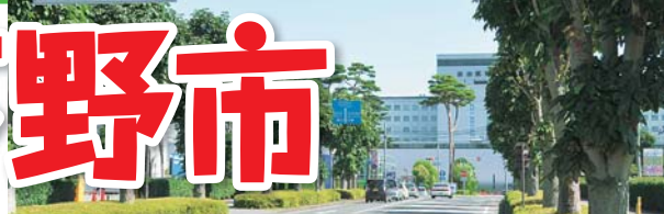
下野市のシンボリック的存在の自治医科大学附属病院周辺