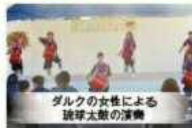
ダルクの女性による 琉球太鼓の演奏