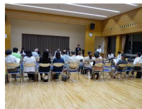
薬師寺コミュニティセンター