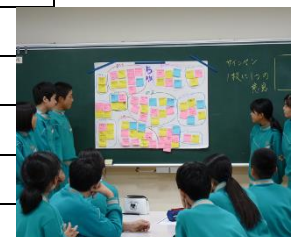
中学生のワークショップ