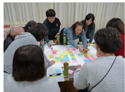
地域・保護者による議論、意見集約

11月6～7日、南河内中学校を会場としてワークショップを開催しました。中学生は1学年生徒全員、教職員は関係する4つの小中学校より35名、地域・保護者の方は41名に参加いただきました。各々2時間程度『魅力的な学校をつくるために、どんなものがあるといいと思いますか?』をテーマに、参加者の自由意見を基に議論し、理想的な学校のイメージをグループごとに取りまとめ発表していただきました。また、関係小学校の児童には、『未来の学校について』をテーマに絵を募集しました。