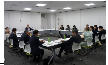
小中一貫教育推進協議会