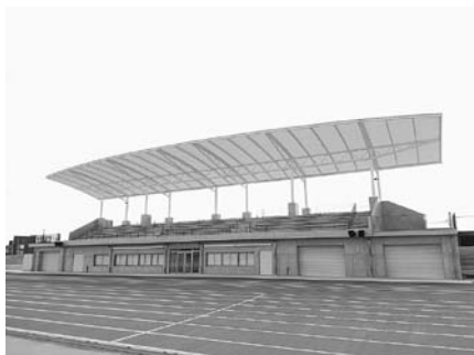
屋根付きの観客席