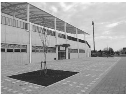
管理棟西側エントランス

大松山運動公園内の施設は、2022年のいちご一会とちぎ国体で会場として利用されます。また、東京オリンピック・パラリンピックの事前キャンプ地としての利用も見込んでいます。