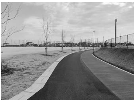
ゴムチップ舗装のランニングコース