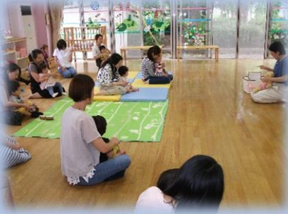
えいごであそぼう 世界にはばたけ！下野っ子！！