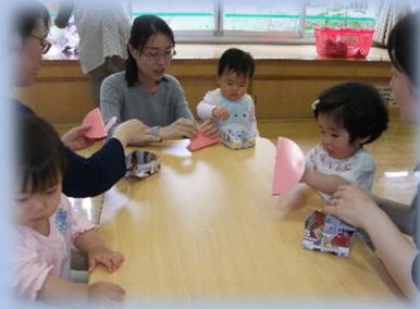
歯磨きにチャレンジ製作！！