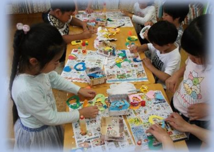
小学生が切り紙に挑戦 涼しそうなお部屋飾りができました