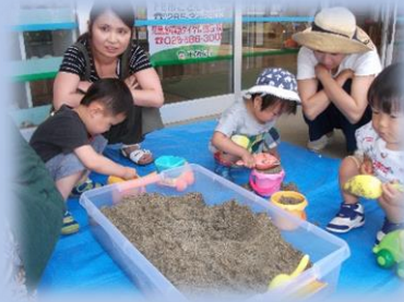
お砂遊び楽しかったね！！