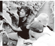
農活体験受け入れ