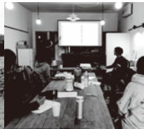
各種セミナー@ゲストハウス