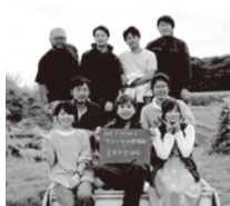
やさしい収穫体験&天丼を食べる会