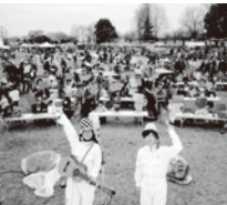
しもつけマーケット