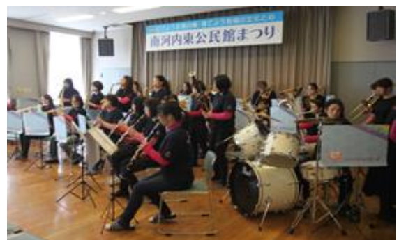
4週目、南河内東公民館が4館のトリを務めます(南東)