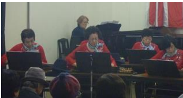
琴邦会による心に響く大正琴の熱演(石)