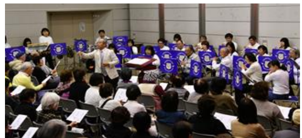
庄巻の演奏！しもつけウインドオーケストラ(国)