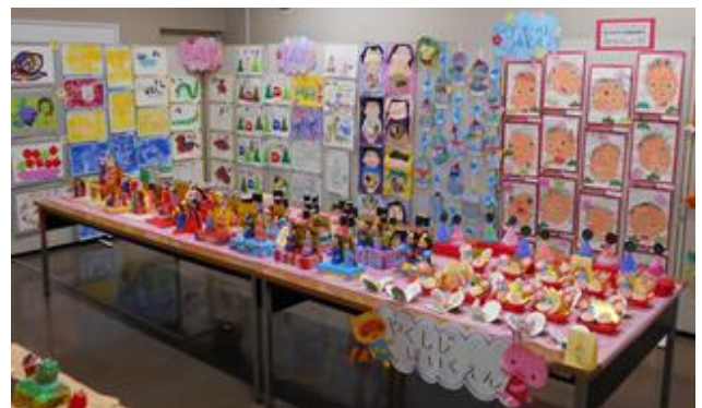
おじいちゃん、おばあちゃん、絶対見に来てね(南)