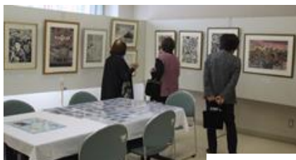
傑作の作品展示の数々(南東)