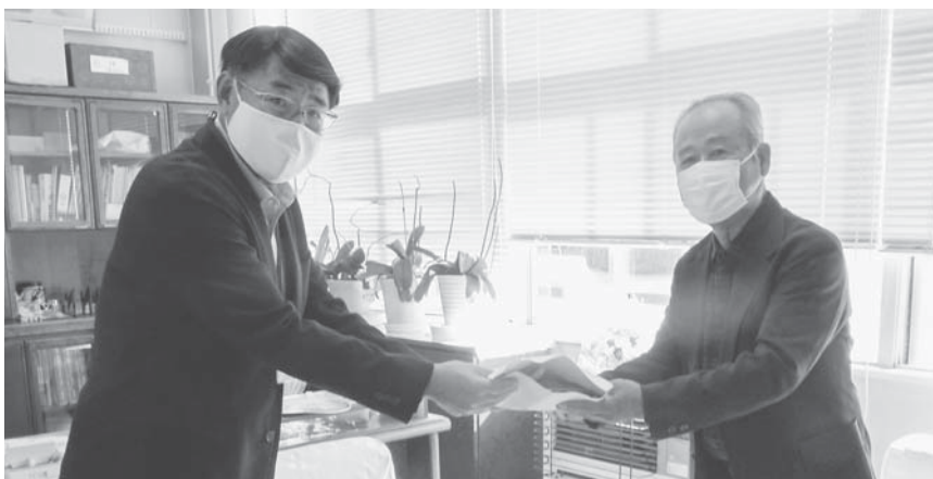
国分寺特別支援学校への贈呈の様子