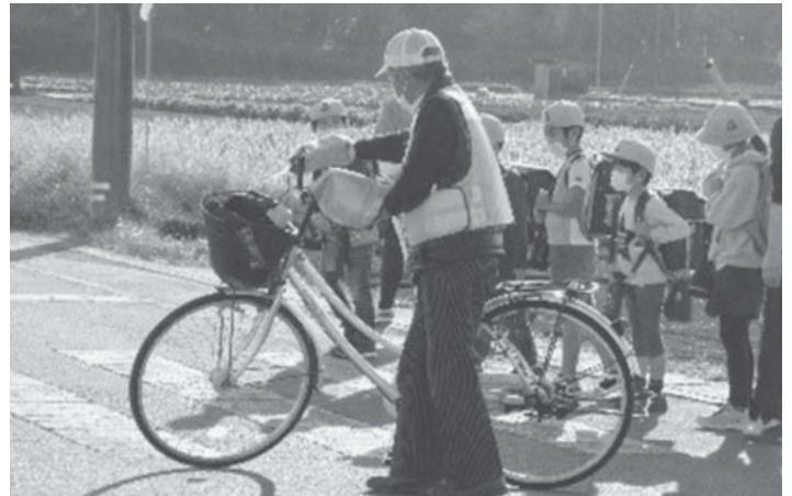
登下校の見守り活動の様子

石橋北小学校区スクールガードボランティアの皆さまは、15年にわたる登下校の見守り活動が高く評価され、「子ども育成・憲章功労団体」として表彰されました。