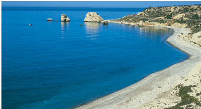
アフロディーテ誕生伝説海岸 ペトラ・トゥ・ロミウ