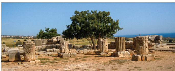
アフロディーテ神殿跡