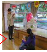
聖火点火で開会式