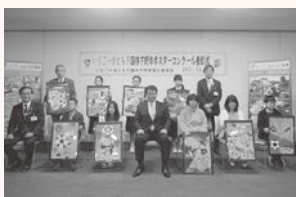
各部門の最優秀作品

小学生低学年・高学年の部、中学生の部で募集したところ、148作品の応募があり、各部門最優秀賞1作品、優秀賞2作品を決定し、表彰式を開催しました。