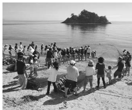
小学生交流の高松市訪問の様子

市が発足する前の平成13年当時、全国で2つだけ「国分寺」を冠する町があった縁で、交流が始まりました。