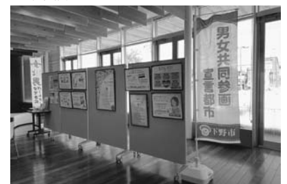
昨年度の展示の様子