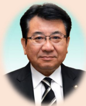
下野市長 広瀬 寿雄