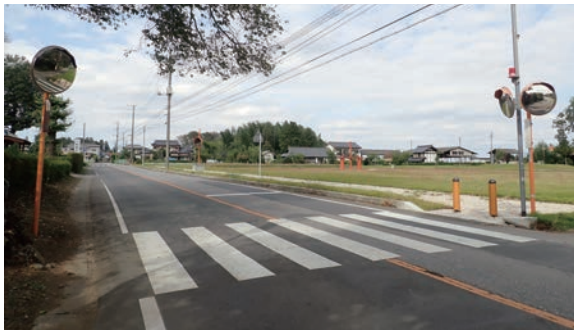
県道の横断歩道（南側）