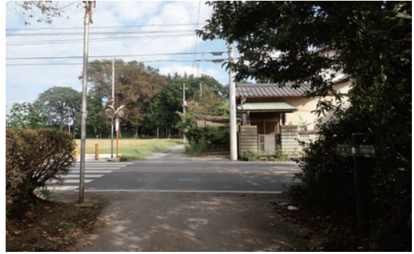
南辺外郭施設東半