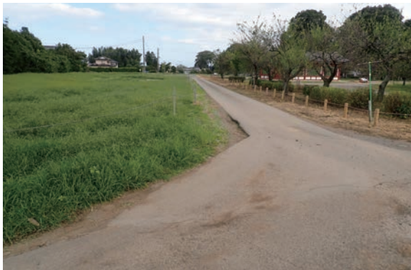
西門跡と指定地内の市道