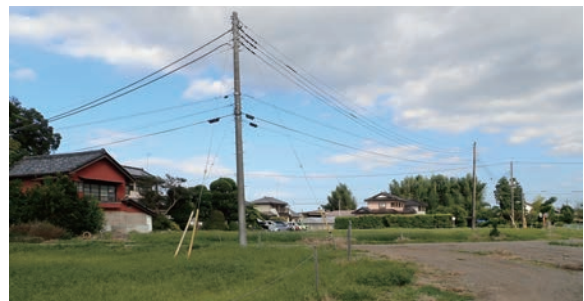
金堂跡周辺の市道と電柱

(5) - ②『第2期整備実施計画書』で整理した課題のうち、現在まで残されている課題