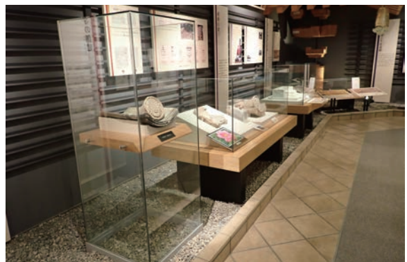
下野薬師寺歴史館の展示

本計画1ページに示した下野薬師寺跡の整備のための(1)～(5)の課題のうち、主に以下の項目の整備実施を目的として、第3期保存整備基本計画を策定する。