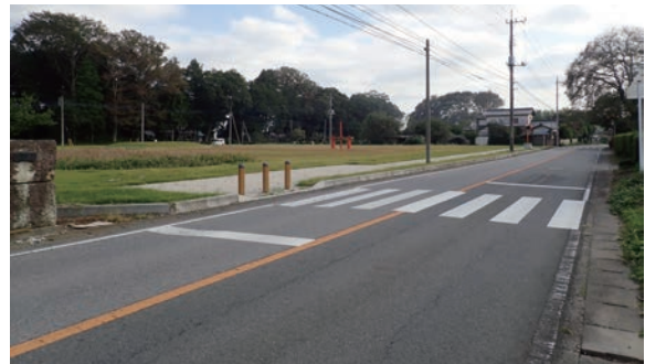
県道の横断歩道（北側）