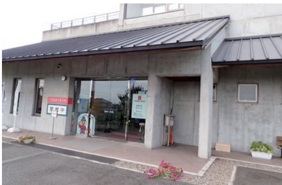
下野薬師寺歴史館の外観