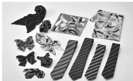
スクールネクタイ・リボン、オフィシャルネクタイ・リボン

■ハネクトーン早川(株) (医大前3-11-1) 1939年の工場創設以来80年以上操業し、国内縫製100%を実現しています。製品は国内トップシェアを誇り、市内中学校をはじめ全国の学校や大手企業など多種多様な職種で着用され、令和4年4月には下野ブランドにも認定されています。