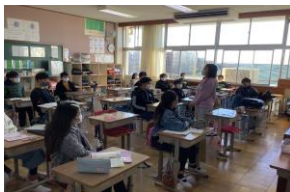
話をする人の方に体を向け、よい姿勢で聞く子供たちの様子。 (祇園小)