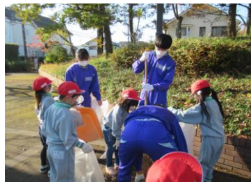
小中合同クリーン活動(R4.11)