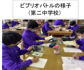
ビブリオバトルの様子 (第二中学校)