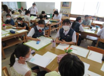
子ども未来プロジェクト会議(R4.7)