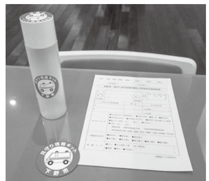
見守り情報キット

名簿に登録した方には、見守り情報キットを配布しています。これは、かかりつけ医療機関、持病、緊急連絡先などの情報を記入した用紙を専用容器に入れ、各ご家庭の冷蔵庫に保管し、ステッカーを貼って表示しておくことで、万一の緊急支援時に活かすものです。