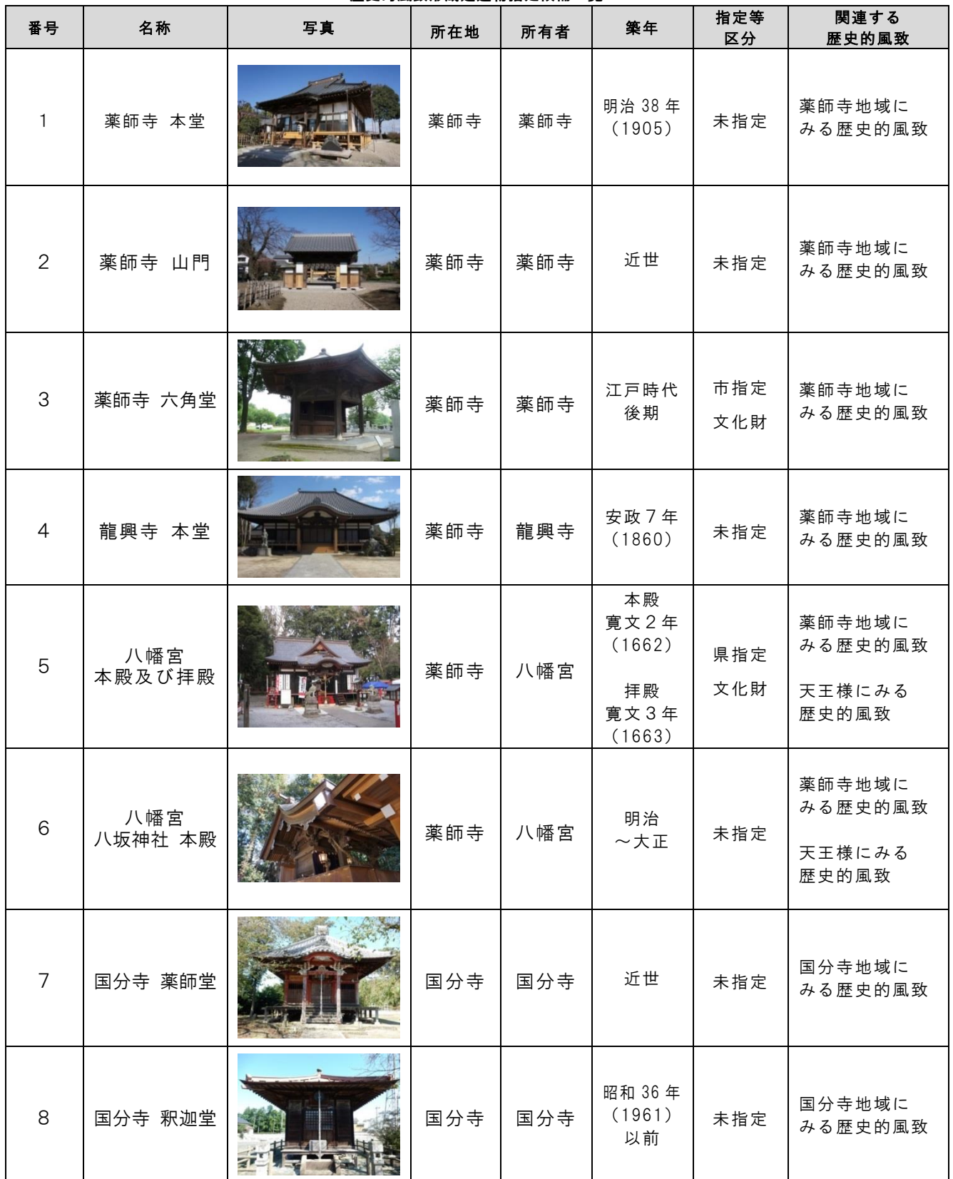
歴史的風致形成建造物指定候補一覧