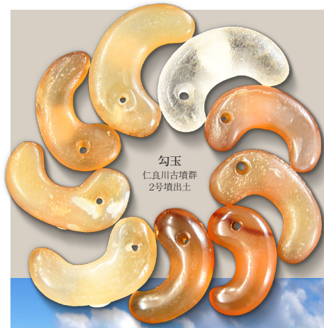
勾玉 仁良川古墳群 2号墳出土