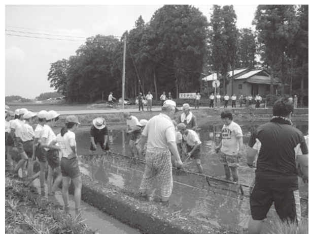
古代米田植え体験の様子